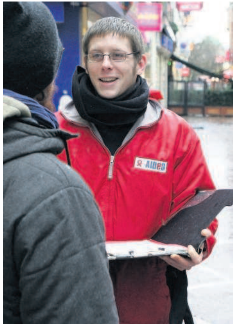
Particularité d'Aides, la multiplication des démarchages dans la rue afin de trouver de nouveaux donateurs.

Pour le comité de la charte, dès qu'une dépense dépasse « 10 % du budget, il faudrait un appel d'offres ». A Aides, les appels d'offres existent certes, mais ne sont pas encore systématiques.